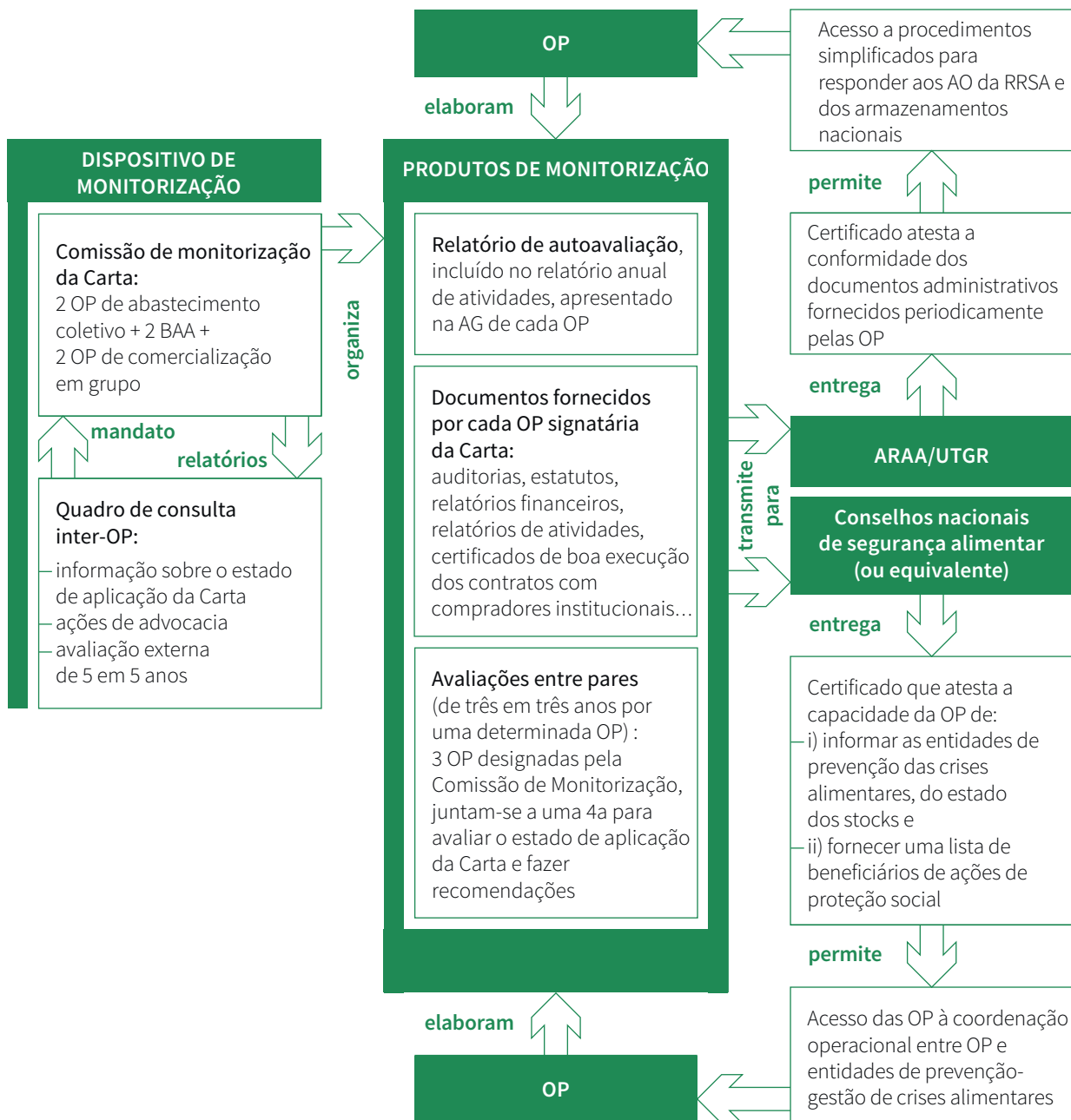
Figura nº1 Dispositivo de monitorização-avaliação da Carta e mecanismos de incentivo à sua aplicação